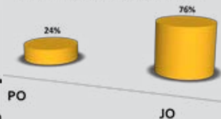
PIESËMARRJA E TË RINJVE NË SHOQËRI